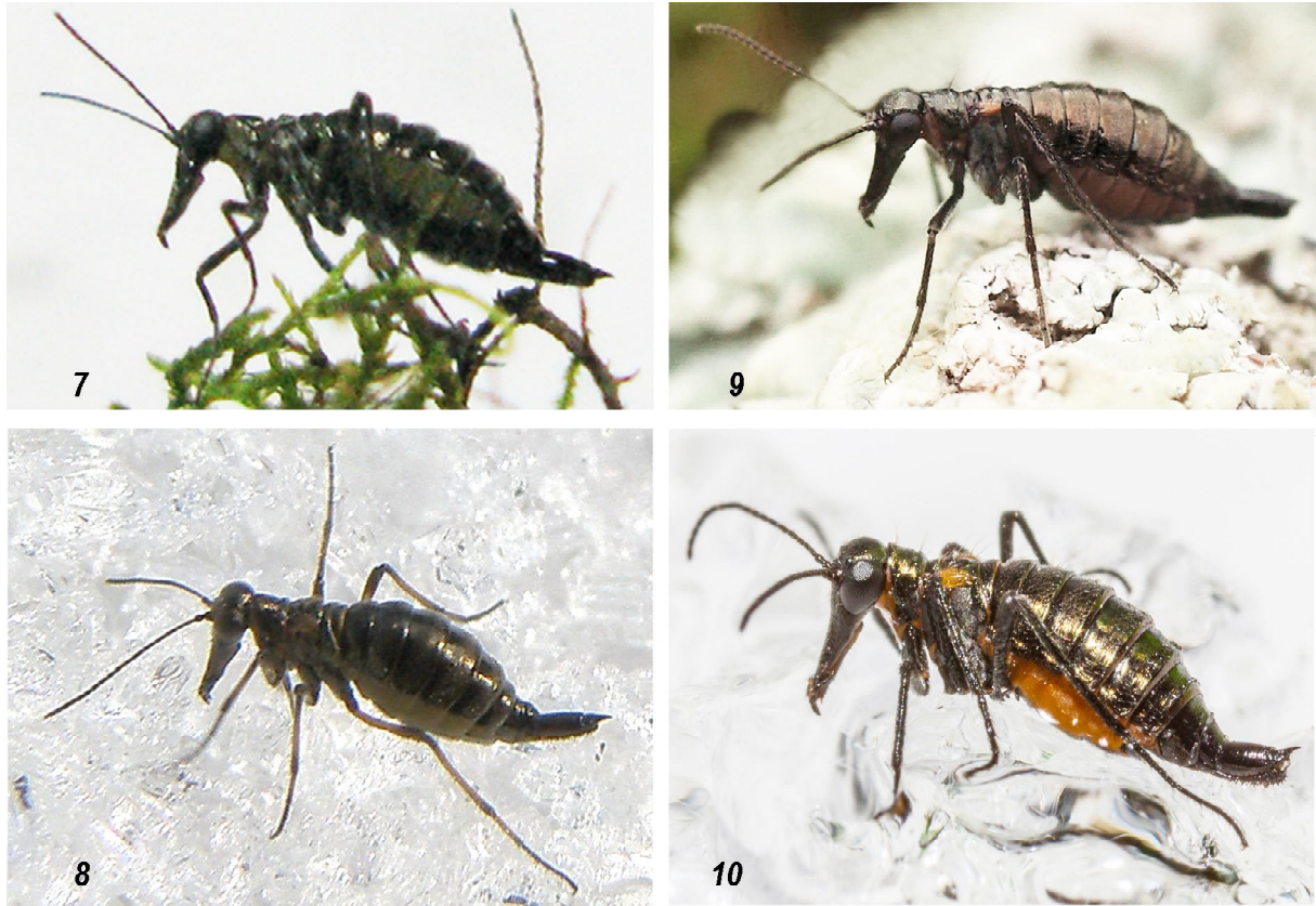
Рис. 7–10. Самки видов рода Boreus Latreille: 7 — B. altaicus Nikolajev, sp.n.; 8 — B. transiliensis Nikolajev, 1998; 9 — B. beybienkoi Tarbinsky, 1962; 10 — B. talassicola Nikolajev, 1998.

Figs 7–10. Female of Boreus Latreille: 7 — B. altaicus Nikolajev, sp.n.; 8 — B. transiliensis Nikolajev, 1998; 9 — B. beybienkoi Tarbinsky, 1962; 10 — B. talassicola Nikolajev, 1998.