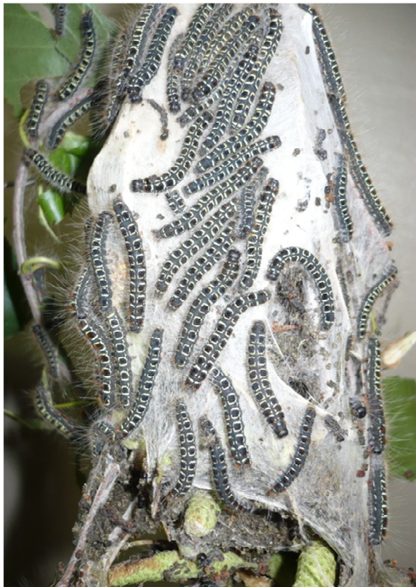
Рис. 1. Паутинное гнездо с гусеницами пушистого коконопряда E. lanestris .

Fig. 1. Cobweb nest with the E. lanestris caterpillars.