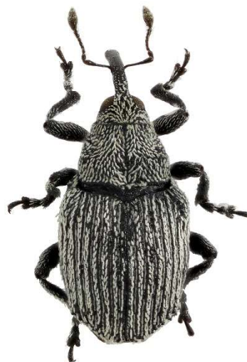
Рис. 1. Ceutorhynchus potanini , общий вид. Fig. 2. External appearance of Ceutorhynchus potanini from Tyumenskaya Oblast. Size 2 mm.

Распространение. Вид имеет дизъюнктивный ареал реликтового типа. Распространён в Восточной Сибири (Якутск), в ряде районов Монголии, на Южном Урале (Оренбургская область и Башкирия) и в Поволжье (Татарстан, Самарская, Ульяновская и Саратовская области) [Korotyaev, 1980; Dedyukhin, 2011, 2012, 2014, 2021, 2022; Alonso-Zarazaga et al., 2017]. В статье вид впервые указывается для Западной Сибири (рис. 1).