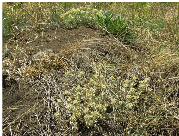
Рис. 4. Alyssum lenense plots in habitat of Ceutorhynchus potanini . Fig. 4. Участки с Alyssum lenense в местообитании Ceutorhynchus potanini .