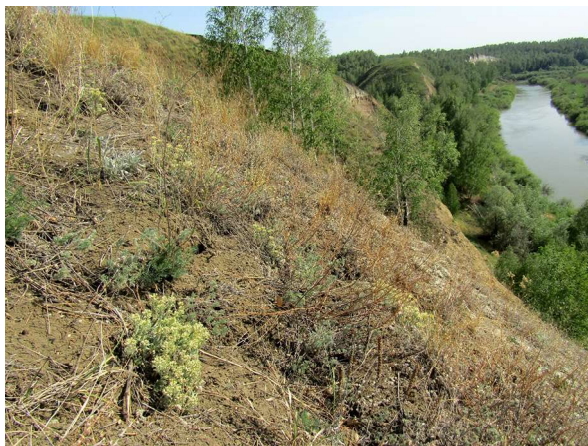
Рис. 3. Местообитание Ceutorhynchus potanini на памятнике природы «Ишимские бугры — Кучумова гора». Fig. 3. Habitat of Ceutorhynchus potanini in the natural monument «Ishimskie bugry — Kuchumova Gora».

Замечания. Ceutorhynchus potanini Korotyaev, 1980 был описан из Восточной Сибири (степные участки в Якутске и его окрестностях) и из нескольких мест в Монголии [Korotyaev, 1980]. При этом он до настоящего времени не указан для горно-степных районов Южной Сибири [Legalov, 2020] (где очень вероятен). Впоследствии вид был неожиданно обнаружен в петрофитных степях на мелах и известняках Приволжской возвышенности [Isaev, 1990, 1994, 1996]. Дальнейшие исследования показали, что C. potanini широко, но мозаично распространён в лесостепной и степной зонах Поволжья и Южного Урала [Dedyukhin, 2011, 2012, 2013, 2014, 2021, 2022; Dedyukhin, Martynenko, 2020], где тесно связан с древними (останцовыми) формами рельефа на равнине или степными низкогорьями.