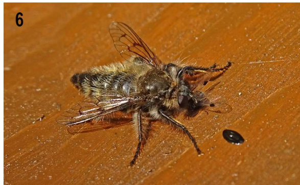
Рис. 3–6. Ктыри из Сихотэ-Алинского заповедника с добычей. 3 — Asilella londti Lehr с Helophilus sp. (Syrphidae, Diptera); 4 — Choerades tenebrosus Lehr с Hypoganomorphus laevicollis (Mannerheim, 1852) (Elateridae, Coleoptera); 5 — Grypoctonus hatakeyamae Matsumura с Stratiomyidae (Diptera); 6 — Grypoctonus hatakeyamae Matsumura с Aphididae (Heteroptera).