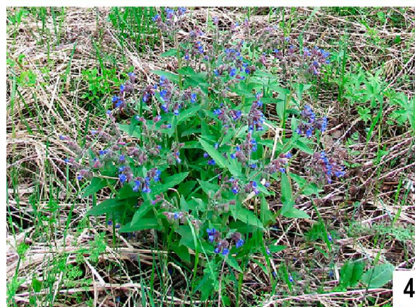
Рис. 3–4. Mogulones larvatus (Schultze, 1897) в естественных местообитаниях на Чувашском мысе, г. Тобольск. 3 — жук на стебле Pulmonaria mollis Wulfen ex Hornem., 1813; 4 — медуница мягкая P. mollis Wulfen ex Hornem.

Figs 3–4. Mogulones larvatus (Schultze, 1897) in natural habitats at the Chuvashskii Mys in Tobolsk. 3 — beetle on stem of Pulmonaria mollis Wulfen ex Hornem., 1813; 4 — P. mollis Wulfen ex Hornem.