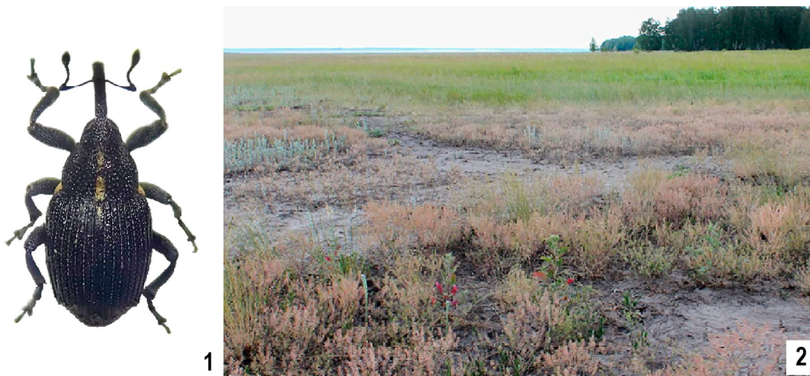
Рис. 1–2. Ceutorhynchus scytha Коротяев, 1980 в естественных местообитаниях в окр. д. Новоалександровка. 1 — общий вид жука; 2 — солонец с куртинами клоповника Lepidium L.

Figs 1–2. Ceutorhynchus scytha Korotyaev, 1980 in natural habitats at the environs of village Novoaleksandrovka, Tyumenskaya Oblast. 1 — external appearance of beetle; 2 — saline soil (solonetz) with Lepidium L.